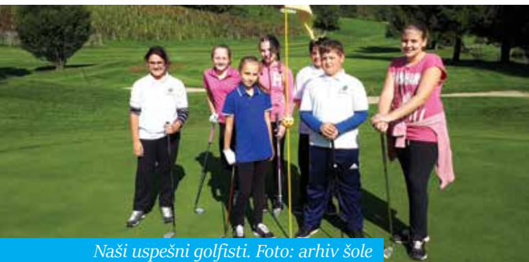
Naši uspešni golfisti.