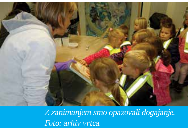
Z zanimanjem smo opazovali dogajanje.