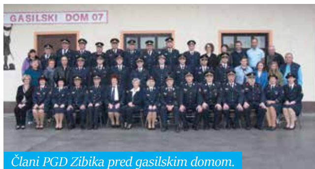
Člani PGD Zibika pred gasilskim domom.

PGD Zibika je praznoval pomembno obletnico, ki smo jo s ponosom obeležili in dodali nov kamenček v mozaik prizadevanj zibiških gasilcev. Spominu naših ustanoviteljev in predhodnikov smo se ob praznovanju 80-letnice poklonili z izdajo dokaj obsežnega zbornika. Bilo je lepo in nepozabno, ostalo bo v naših spominih in na fotografijah, nas pa že čaka novo desetletje, polno novih izzivov. Zibiški gasilci se še enkrat iskreno zahvaljujemo vsem, ki ste na kakršenkoli način prispevali k nepozabnemu praznovanju našega jubileja.