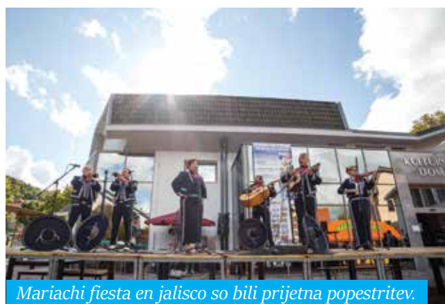
Mariachi fiesta en jalisco so bili prijetna popestritev.