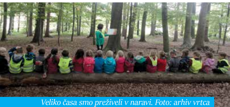
Veliko časa smo preživel v naravi.

Takšna je bila letos tema ob tednu otroka. V vrtcu Šmarje pri Jelšah so se odvijale najrazličnejše dejavnosti: pravljice v naravi, poligoni v naravi, raziskovanje okolice, glasbeno dopoldne. Vrtec je organiziral tudi ogled intervencijskih služb, kar je bilo za otroke posebno doživetje, prav tako za druge obiskovalce. Spoznali smo opremo in delo policije, gasilcev, reševalcev, gorskih reševalcev, jamarjev, vojakov, civilne zaščite. Imeli smo tudi popoldansko srečanje otrok, staršev in strokovnih delavcev, ki je bilo namenjeno druženju, gibanju, raziskovanju in pridobiva-