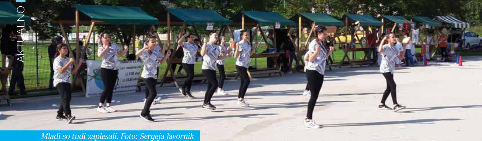
Mladi so tudi zaplesali.