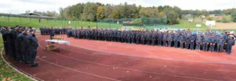
Udeleženci območnega tekmovanja v Šmarju pri Jelšah pred razglasitvijo rezultatov.