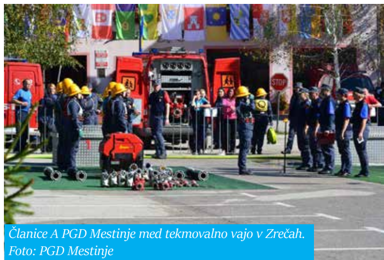
Članice A PGD Mestinje med tekmovalno vajo v Zrečah.

izvajali mokro vajo s hidrantom, reševali teste in se izkazali v vaji razvrščanja. Najboljše tri tekmovalne enote iz vsake kategorije so se udeležile regijskega tekmovanja. Tam so tekmovali: pionirke Kristan Vrha, Šentvida pri Grobelnem in Sv. Štefana, pionirji Šmarja pri Jelšah, Zibike in Sv. Štefana, mladinke Šentvida pri Grobelnem ter mladinci Mestinja in Kristan Vrha. (S)