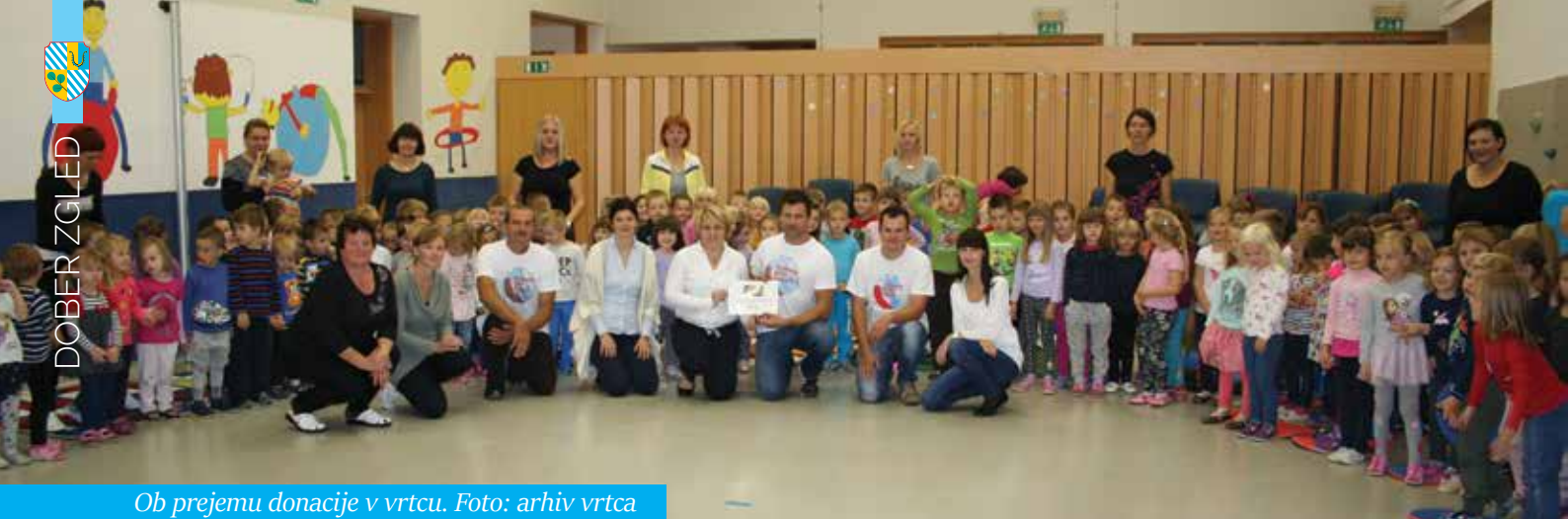
Ob prejemu donacije v vrtcu.