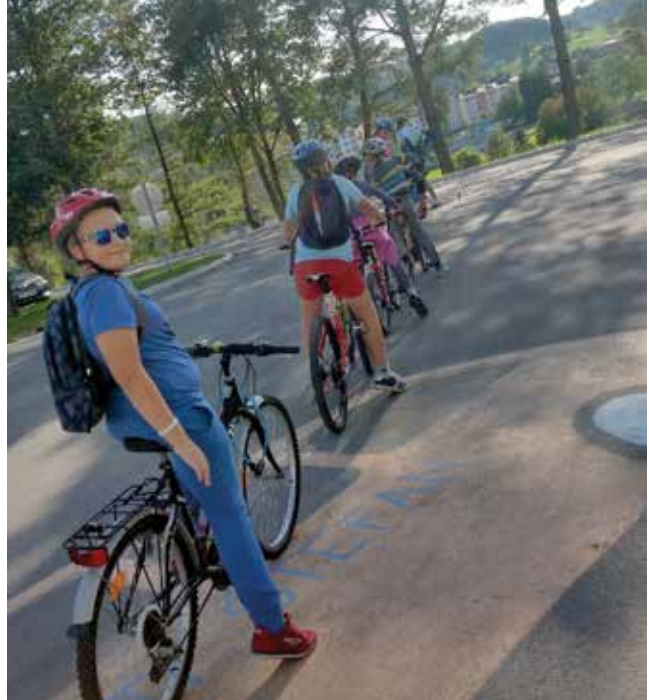
Kolesarili smo do Podčetrtna in Rogaške Slatine.