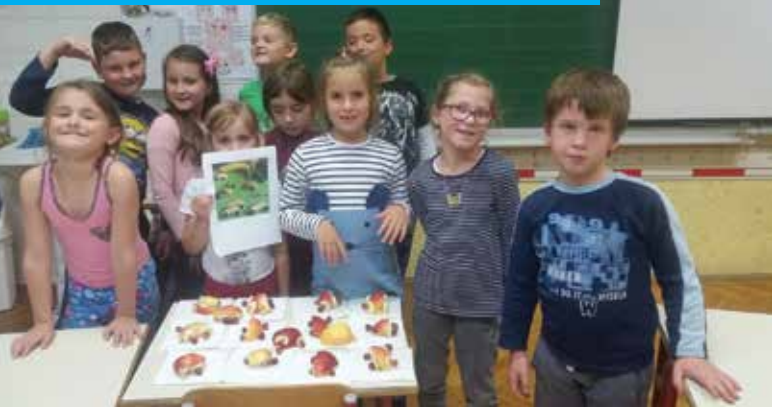
Slastni sadni avtomobili.