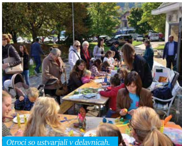
Otroci so ustvarjali v delavnicah.