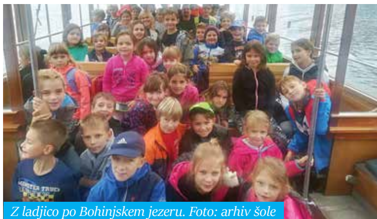
Z ladjico po Bohinjskem jezeru.