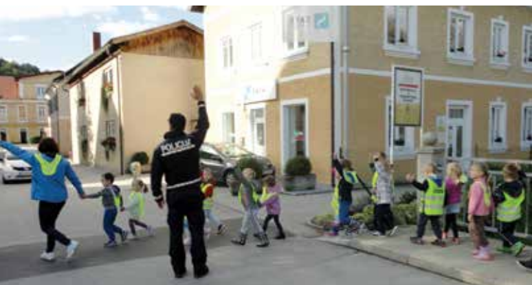
Varno čez cesto ob spremstvu policista.