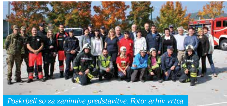
Poskrbeli so za zanimive predstavitve.