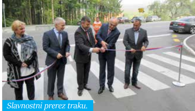
Slavnostni prerez traku.

občine. »Zelo sem vesel, da je prišlo do ureditve na Halarjevem hribu, tako da je zdaj križišče bolj varno za otroke, urejenost pa prispeva tudi k lepši podobi kraja,« je dejal župan.