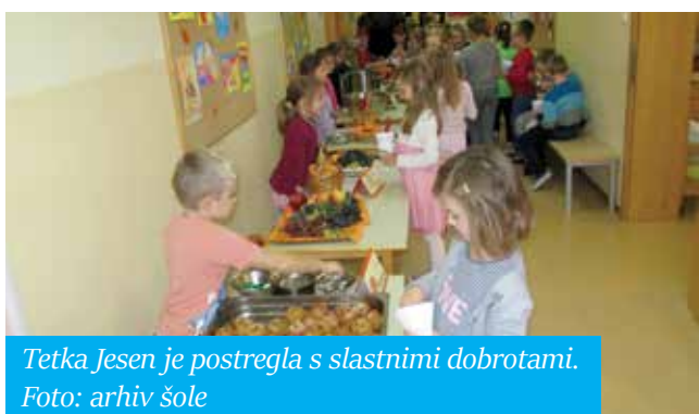
Tetka Jesen je postregla s slastnimi dobrotami.