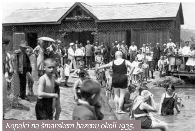
Kopalci na šmarskem bazenu okoli 1935.

prebivalstva je bil težak. Zdravnik je obiskoval bolnike večinoma na njihovih domovih. Veliko posegov, ki jih danes opravijo specialisti le v bolnišnicah, je bilo treba opraviti kar pri bolniku doma. Delal je v primitivnih razmerah, brez antibiotikov, s pomanjkljivo opremo. Lotil se je primerov v porodništvu in kirurgiji, ki bi bili brez interventne zdravstvene pomoči brezupni. Reševalna služba je v Šmarju začela delovati šele leta 1946.