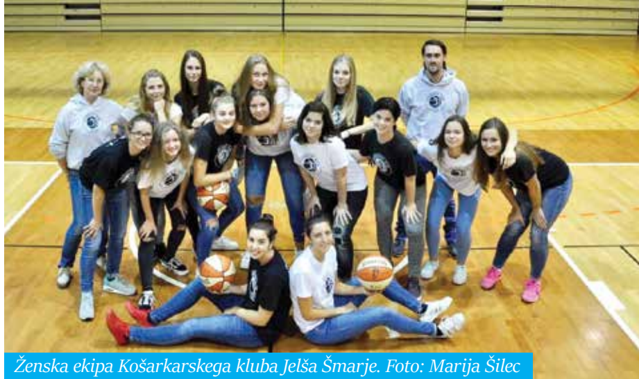
Ženska ekipa Košarkarskega kluba Jelša Šmarje.