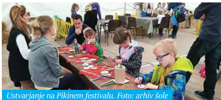
Ustvarjanje na Pikinem festivalu.