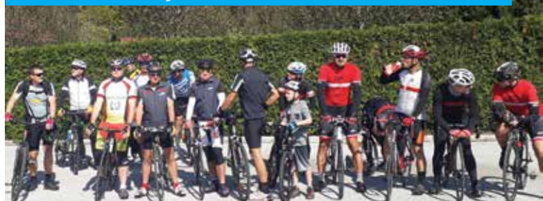
Udeleženci kolesarskega maratona Dan na kolesu.

Bolje pripravljene kolesarje so za približno 24 km dolgo pot potrebovali slabo uro, najhitrejši le dobrih 40 minut. Kar nekaj kolesarjev se je odločilo za podaljšanje prve etape mimo doline Winettou skozi Majšperk do krožišča na Ptujski Gori in nazaj do doline Winettou v skupni dolžini 37,5 km. Sledil je počitek ob odlično pripravljene jedači in pijači.