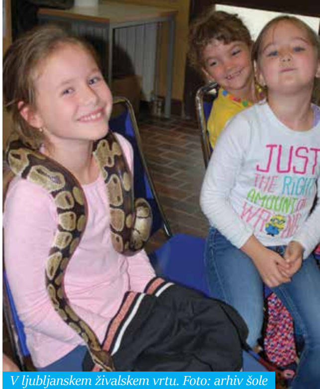
V ljubljanskem živalskem vrtu.