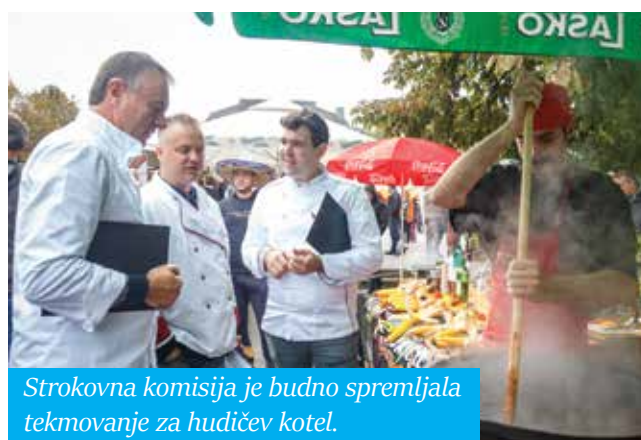
Strokovna komisija je budno spremljala tekmovanje za hudičev kotel.