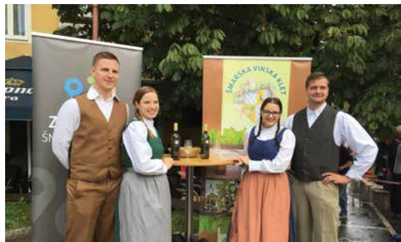
Mladi folklorniki so vabili v odprto vinsko klet.