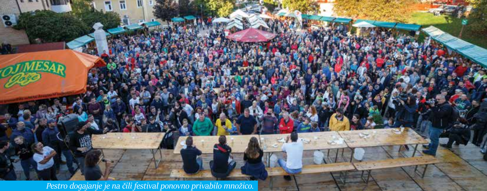
Pestro dogajanje je na čili festival ponovno privabilo množico.