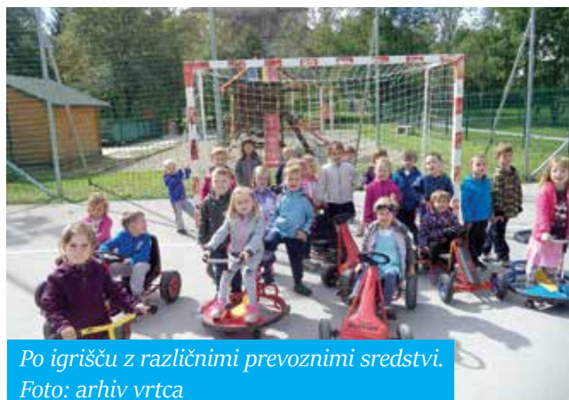
Po igrišču z različnimi prevoznimi sredstvi.

Ob tednu mobilnosti je tudi vrtec Šmarje sodeloval v projektu Združimo moči, delimo si prevoz. Cilj projekta je bil, da se otroci seznanijo z varnim vedenjem v prometu in se naučijo živeti in ravnati varno v različnih okoljih bodisi v prometu, vrtcu, doma, pri igri, športu, pohodih ... S projektom smo otroke in nas spodbujali h gibalnim dejavnostim in osveščali o pomenu gibanja za zdravje. Dejavnosti, ki smo jih izvajali v različnih skupinah, so bile: obisk knjižnice s pravljico, povezano s prometom, uporaba prevoznih sredstev (skiroji, formule, poganjalci), pravljice in zgodbe o prometu, športno dopoldne, poligoni v naravi, vadbene ure v telovadnici na temo avto, sprehod s policistom, pogovor s policisti in člani SPV-ja. Otroci so uživali v vseh gibalnih dejavnostih, najbolj pa so jim bila vseh prevozna sredstva na asfaltnem igrišču.