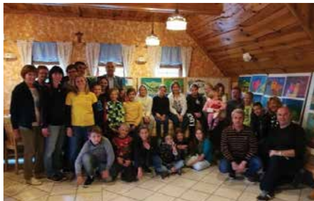
Udeleženci likovne delavnice z gosti.