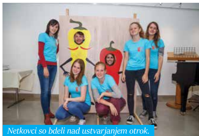
Netkovci so bdeli nad ustvarjanjem otrok.