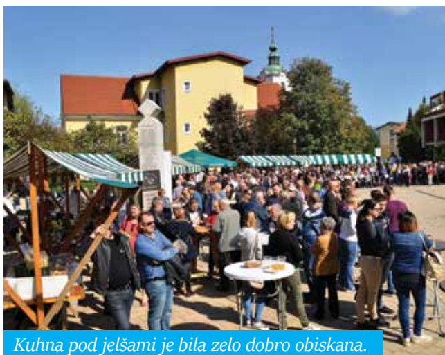
Kuhna pod jelšami je bila zelo dobro obiskana.

Med tem, ko so godbe igrale na različnih lokacijah po Šmarju in bližnji okolici, so se na ploščadi pred kulturnim domom že pripravljali gostinci, ki so poskrbeli za kulinarični del festivala – kuhno pod jelšami. Za kulinarične užitke na festivalu so svoje kuhinje predstavili: Hiša okusov, gostilna Šempeter, restavracija Zadrufnik, pivovarna in pivnica Lipnik, Kameleon – slastne ideje in Hiša vin Emino. Seveda dobrot ni manjkalo niti na stojnicah kmečke tržnice.