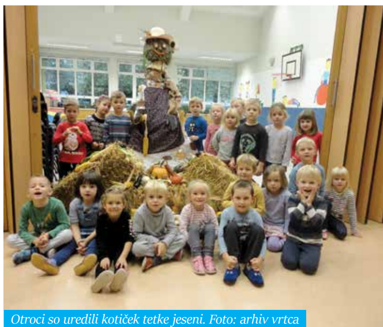
Otroci so uredili kotichek tetke jeseni.