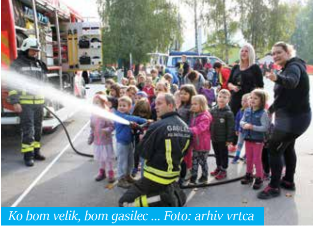
Ko bom velik, bom gasilec ...