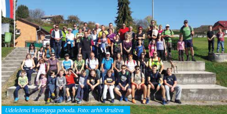
Udeleženci letošnjega pohoda.

Športno društvo (ŠD) Mestinje vsako leto po koncu poletnih počitnic organizira tradicionalni pohod po krajevni skupnosti Mestinje. Že 16. pohoda se je na prelepo nedeljsko popoldne, 15. oktobra, zbralo rekordno število pohodnikov - okoli 60, od tega precej mlajših. Najstarejši pohodnik je štel preko 70 pomladi, najmlajša »pohodnica v očetovem kenguruju za nošenje otroka« pa šele nekaj mesecev. Nekaj po 13. uri se je pisana skupina odpravila na razgibano 14,2 kilometra dolgo pot. Izjemno primerno vreme (sončno in s temperaturami okoli 20 stopinj Celzija) nas je spremljalo ob celotni trasi. Tradicionalna pot je pohodnike vodila iz Mestinja preko Krtinc do Lemberga, kjer smo opravili tradicionalni »vzpon« po travniku do cerkve sv. Pankracija, ki je letos še posebej lepo sijal v prenovljeni po-