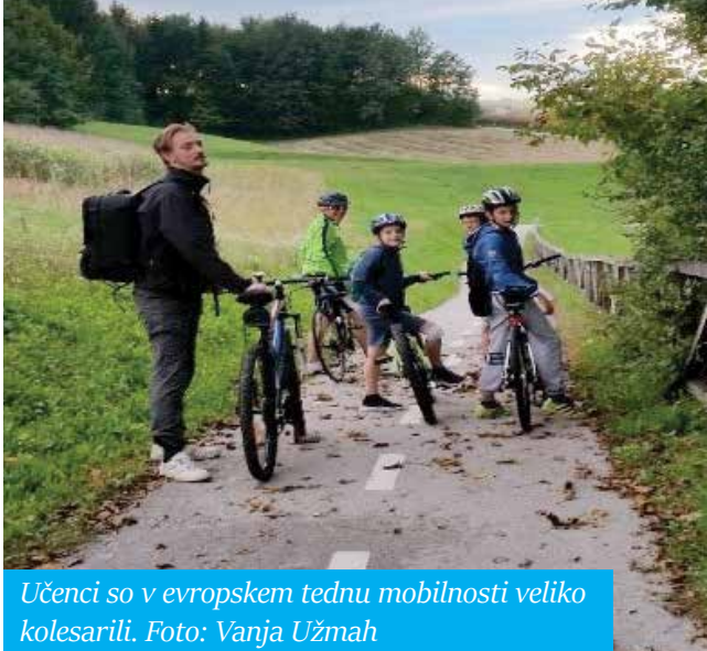
Učenci so v evropskem tednu mobilnosti veliko kolesarili.