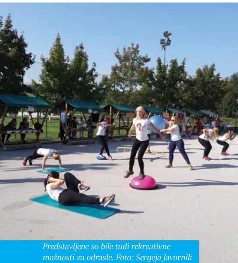
Predstavljene so bile tudi rekreativne možnosti za odrasle.