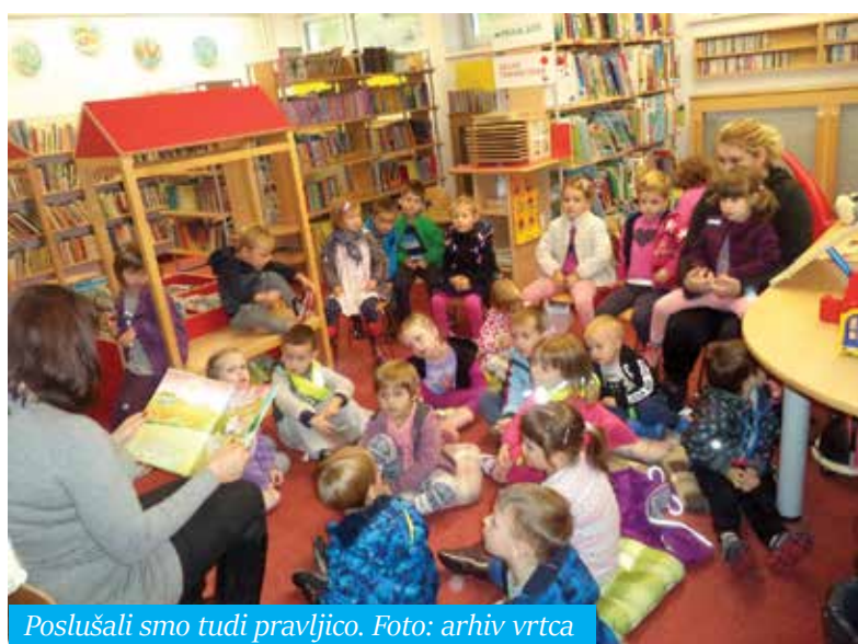
Poslušali smo tudi pravljico.