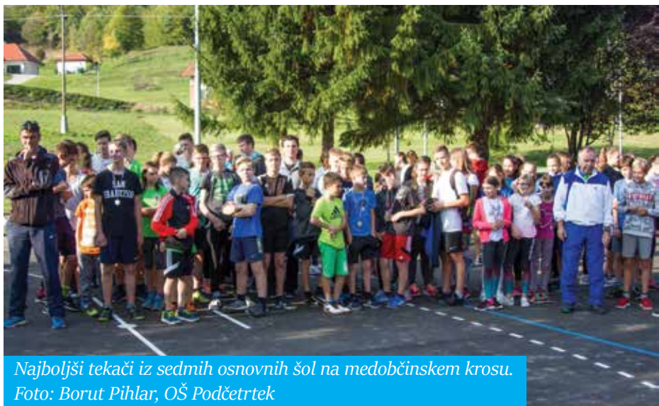
Najboljši tekači iz sedmih osnovnih šol na medobčinskem krosu.