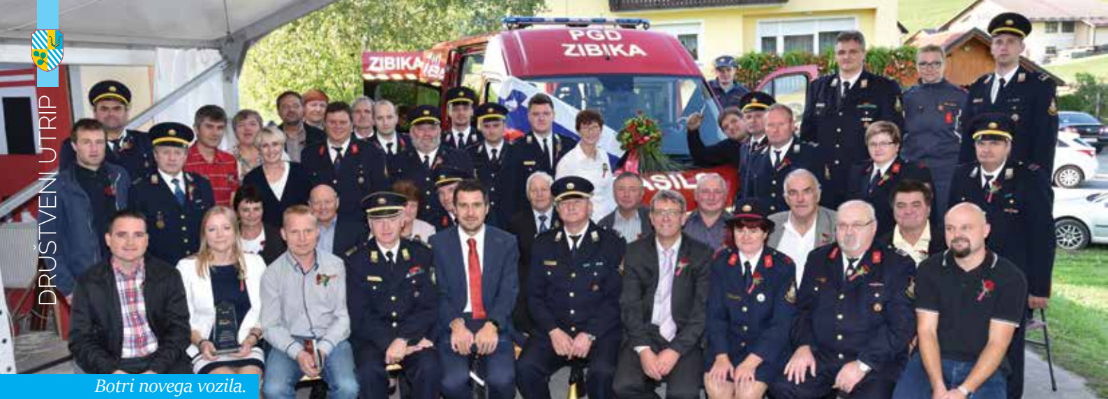
Botri novega vozila.