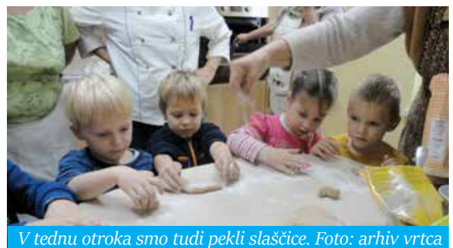
V tednu otroka smo tudi pekli slaščice.