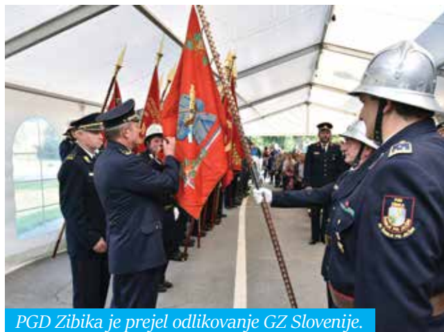
PGD Zibika je prejel odlikovanje GZ Slovenije.

Uradnemu delu je sledilo druženje pod šotorom. Vsi prisotni so uživali v sproščenem klepetu ob dobri hrani in pijači, za plesa željne pa so poskočne viže igrali člani ansambla Utrinek.