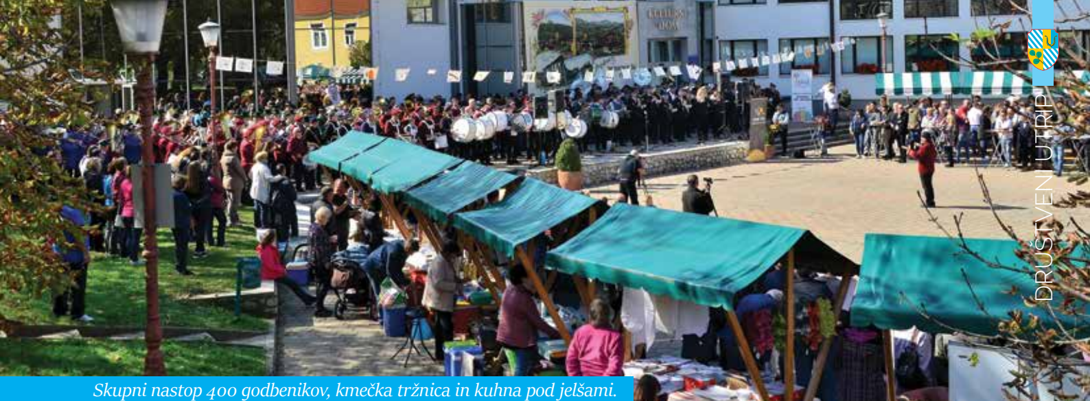
Skupni nastop 400 godbenikov, kmečka tržnica in kuhna pod jelšami.